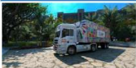
Caminhão "Conhecendo os ODS" chega a Itapoá com serviços e atividades sociais e culturais para toda a família