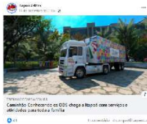
Caminhão Conhecendo os ODS chega a Itapoá com serviços e atividades para toda a família