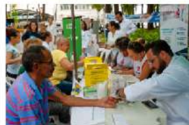
Caminhão Conhecendo os ODS leva atendimentos e atividades culturais para o litoral catarinense