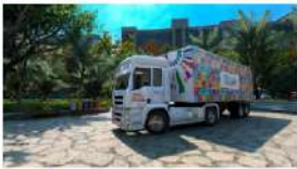
Caminhão Conhecendo os ODS chega a Itapoá com serviços e atividades para toda a família