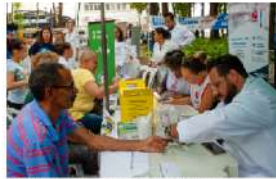
Caminhão Conhecendo os ODS leva atendimentos e atividades culturais para o litoral catarinense