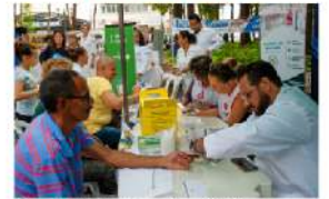
Caminhão Conhecendo os ODS leva atendimentos e atividades culturais para o litoral catarinense