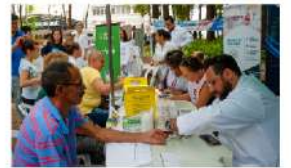
Caminhão Conhecendo os ODS chega a Itapoá com