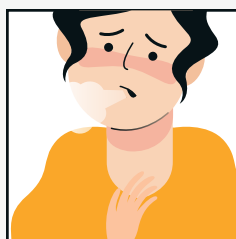
Dificuldade para respirar